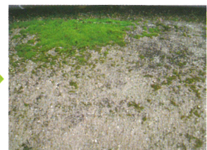
緑のコケが広がる