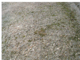
黒カビの上にコケが生えだす